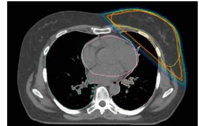
CT in Atemmittellage

Untenstehend ein Beispiel einer Radiotherapie der linken Brust (oben in Atemmittellage, unten in tiefer Einatmung): Man erkennt deutlich, dass in tiefer Einatmung das Lungenvolumen zunimmt und sich das Herz gut von der zu bestrahlenden linken Brust zur Mitte hin entfernt. In diesem Beispiel hatten wir eine Verringerung der Herz- und Lungenbelastung von jeweils fast 50 %!